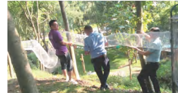
四季花海温泉酒店分公司为养心苑“萌宠”松鼠安装跑道