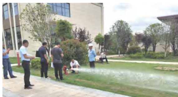
5月31日，四季花海九龙湾A区商业综合楼完成消防验收