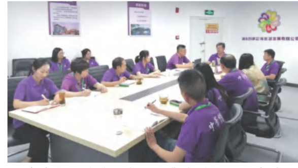
四季花海旅游营销分公司集中传达公司高管赴陕西考察学习情况及全省景区培训会议精神