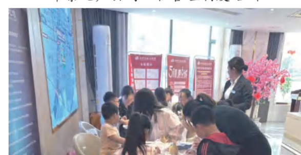
5月27日四季花海九龙湾营销中心举行庆六一DIY亲子活动