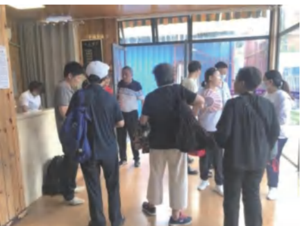
5月18日，改造后的青春驿站迎来首批客人——武汉航测遥感院党建团队，沉寂近半年的驿站再度启动运营。

景区分公司从大局出发，勇于担当，于今年四月接盘。经过认真分析、反复研究论证，选出最优的改造方案。并迅速协调组织酒店工程部、景区工程部、景区水电班加班加点实施维修、改造方案。红培研学部接手负责综合管理，组织全员协助抢抓开荒，招商落实了餐饮配套。园林部及时跟进，调运花卉进行景观布展。酒店分公司积极支持，选派熟练前厅业务人员协助开展工作。在各专业部门积极推进和齐心协力下，青春驿站按计划完成改造计划，整体面貌焕然一新，重现“青春”风貌。