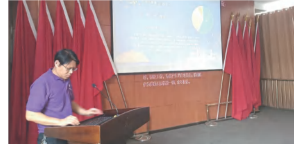
四季花海置业公司举行《房产销售与工程》全员培训