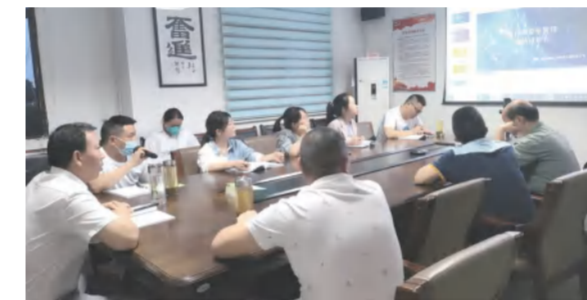
建筑事业部举行“项目安全管理总结讨论会”