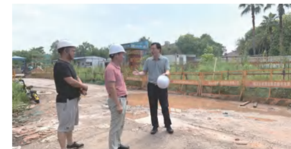
6月5日董事长在广东佛山工程项目现场视察指导