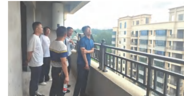
5月30日，中德仁和公司、四季花海置业公司联合迎接九龙湾A区H7号楼创建黄冈“大别山”杯专家现场验收