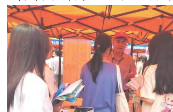
四季花海公司招聘走进湖北生态职院