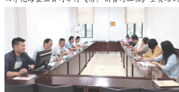
中泰地产公司工程管理制度培训