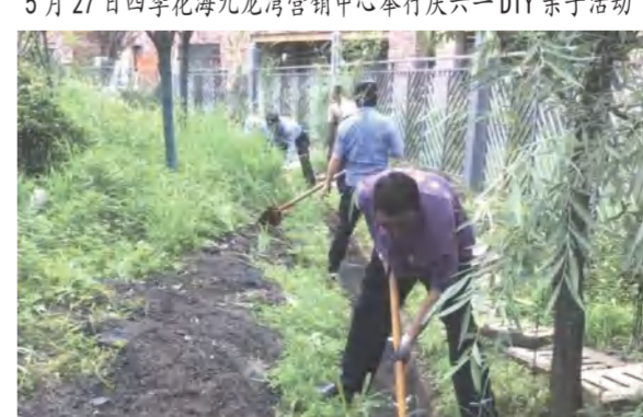
六合众物业公司组织雨后清沟集体劳动