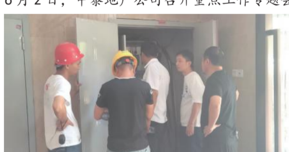
6月12日，湖北金港汽车公园项目，4、5、9、10、19号楼水电安装联合验收