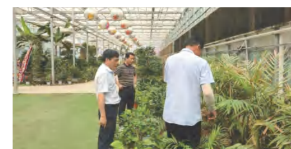
四季花海旅游公司领导现场研究花立方园林生产