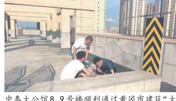
中泰大公馆8、9号楼顺利通过黄冈市建筑“大别山杯”专家现场验收