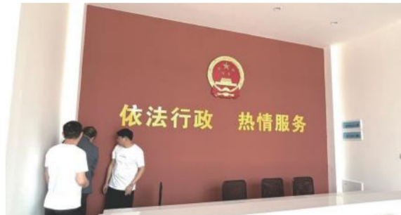
5月25日，四季花海置业公司对落户在芬兰风情街的“英山县婚姻登记处”进行装修验收