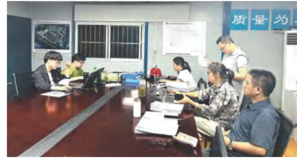
5月15日，成本预算部在湖北金港汽车公园项目现场指导工程结算材料报验事宜