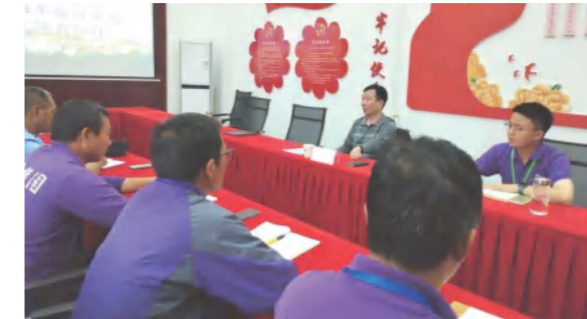
5月中旬，四季花海公司2023年度管理人员激励考核责任书签订。图为董事长在景区分公司宣讲指导年度激励考核工作