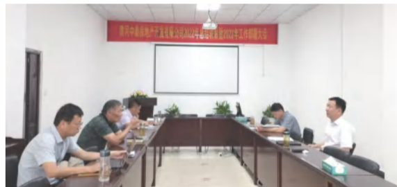
6月2日，中泰地产公司召开重点工作专题会