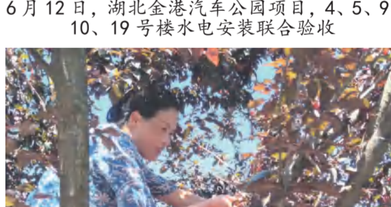
华美达酒店餐饮部采摘景区自种的李子作为生态水果上餐桌