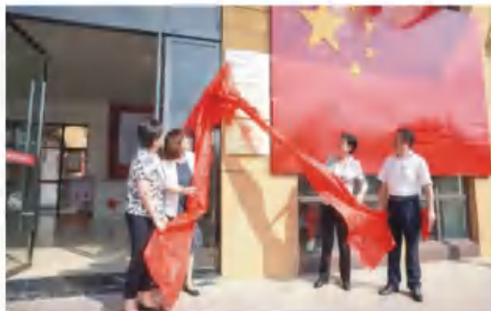
7月6日，湖北省省直机关党员干部教育基地在英山长征精神体验园正式挂牌

化资源，利用和传承红色基因，高标准打造红色教育基地，成功建设成为省、市直属机关党员干部教育基地。英山长征精神体验园以“基地+课堂”为模式，以“长征魂·中国梦”为教育主题，创新研发了“8+X”全程沉浸式体验式教学模块，增强了党员教育管理的吸引力和感染力，深受前来参观体验学员的一致好评。