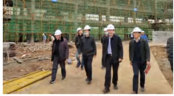
2021年3月10日，董事长参加武汉光谷第五小学足球分校项目工作目标及责任清单讨论会。