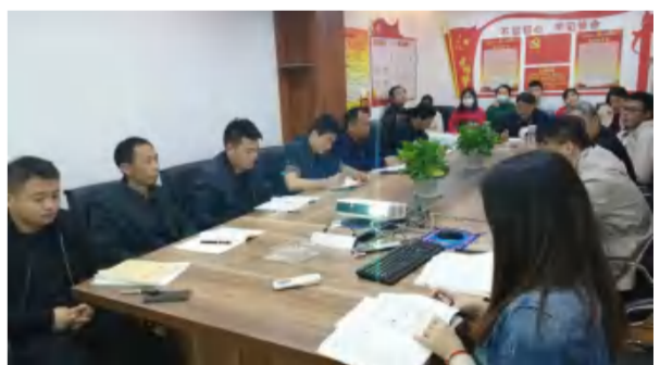
2021年3月22日，中泰地产公司学习讨论管理制度。