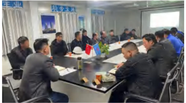
2021年3月15日，建筑事业部东方明珠B区项目召开各分包班组质量、安全、进度会议。