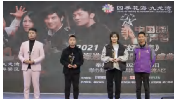
2021年3月8日，中国好声音英山赛区颁奖典礼在四季花海·九龙湾A区举行。