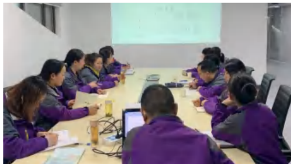
2021年3月16日，四季花海旅游公司财务部学习财务管理制度。