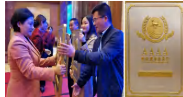
省文旅厅厅长雷文洁为四季花海颁授国家AAAA级景区牌匾

——品牌建设：英山四季花海景区正式完成“国家AAAA级景区”挂牌；英山长征精神体验园被中共湖北省直机关工委认定为“湖北省党员干部教育基地”；四季花海置业公司“房地产开发资质”从暂定级升至四级；中德仁和建设工程有限公司启动了工程总承包一级资质的晋升准备工作。