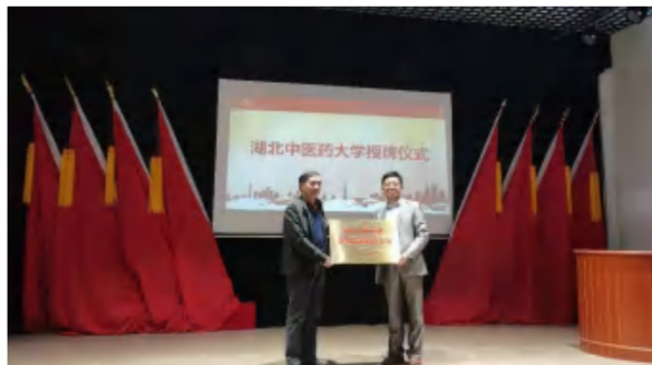
2021年4月15日，湖北中医药大学党员干部教育基地在英山长征精神体验馆挂牌。