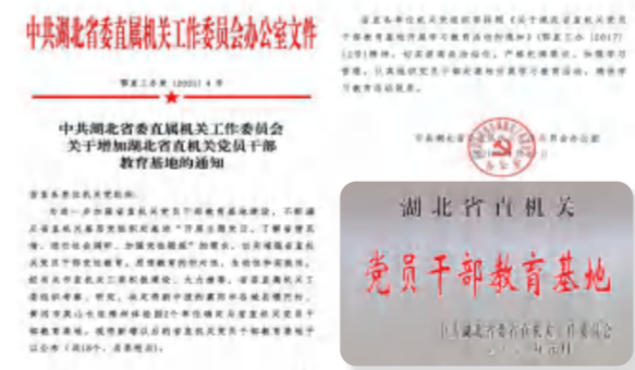
长征精神体验园被中共湖北省直机关工委增加到党员干部教育基地列表

——社会荣誉：在全省扶贫攻坚总结表彰大会上，湖北四季花海旅游发展有限公司被授予“全省扶贫攻坚先进集体”；湖北省政府对2020年“与爱同行 惠游湖北”活动的先进单位进行表彰，英山四季花海景区被评为“优质服务景区”；由湖北省文旅厅组织的“全省红色旅游十佳评选活动”中，英山长征精神体验园入围参选“红色经典景区”、3名讲解员入围参选“红色讲解员”并名列前茅；在黄冈日报社、鄂东晚报组织的网络评选中，四季花海景区、养心苑野奢酒店被评为“黄冈市旅游网红景点打卡地”、“黄冈市网红民宿”；四季花海旅游公司被评为英山县2020年文旅工作先进单位，并在全省文旅工作会议上作典型交流发言。