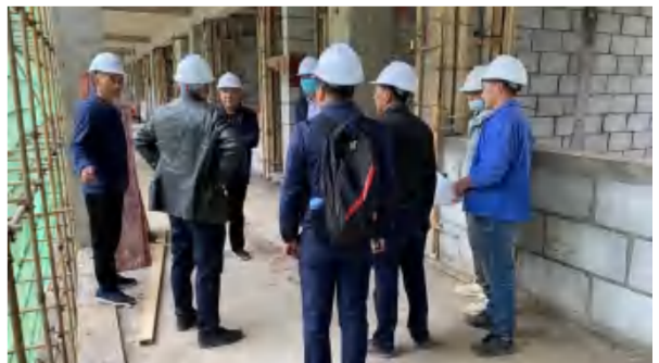
2021年3月30日，教育局及街道办对武汉光谷五小足球分校项目样板间进行检查及提出指导。