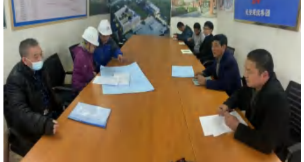
2021年3月15日，武汉光谷第五小学足球分校项目高支模专项施工方案专家回访。