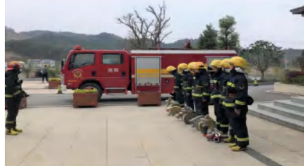
2021年3月9日，湖北消防黄冈支队在四季花海华美达酒店进行消防系统演习检查。