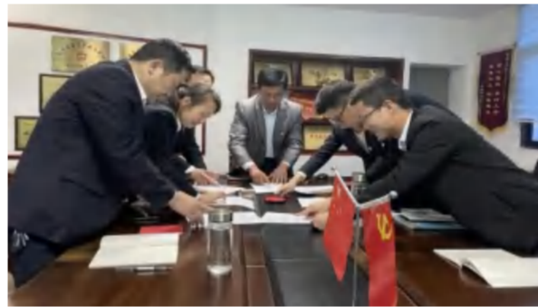
2021年3月1日，集团组织党员举行五星党组织“做模范，践行动”承诺签字仪式。