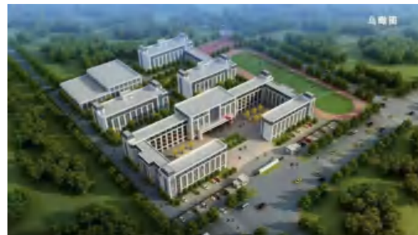
2021年4月3日，新时代国际学校落户四季花海项目区。