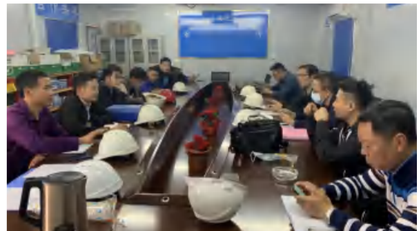
2021年3月9日，云东海26-31座、幼儿园工程主体结构分部验收