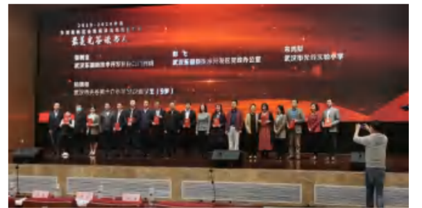
中国光谷·党工委组织十大“最美光谷读书人”活动

——政商关系：集团体系各相关产业主体公司的政商关系进一步优化和密切，相关单位持续得到省、市、县领导的关心、重视和支持，各级领导指导视察、现场办公的频次在2021年一季度明显提高；“中信仁和集团党建共建”、“四季花海文旅康养融合发展”、“英山四季花海联合片区党委”、“英山九龙湾乡村振兴先行区”等模式案例，不断提升政治站位和社会效益，引发综合效应；集团综合资源优势得到进一步发挥，在整合武汉特别是东湖高新区党建及红色教育培训资源方面亮点突出、效应在不断显现；媒体关